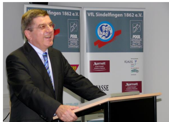
IOC-Präsident Dr. Thomas Bach beim Besuch der VfL - Sportwelt